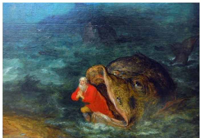
למטה: יונה יוצא ממעי הדגה. יאן ברויגל האב (1568-1625). מוזיאון פינקוטק הישן, מינכן.