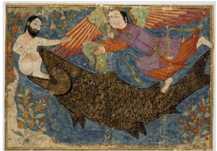
למעלה משמאל: יונה והדג במפרץ חיפה (1977). יוג'ין (יבגני) אבסהאוס, אוסף פרטי, ישראל.